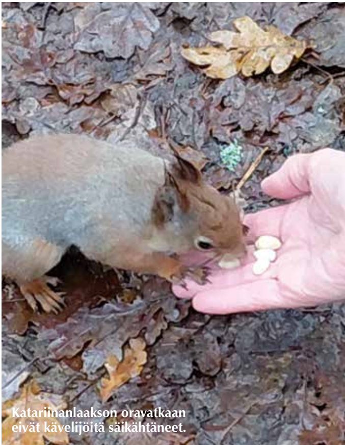
Katariinanlaakson oravatkaan eivät kävelijöitä säikähtäneet.