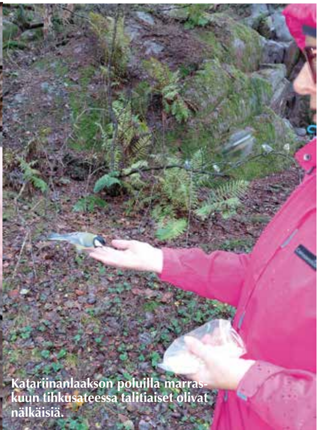
Katariinanlaakson poluilla marraskuun tiikusateessa talitiaiset olivat nälkäisiä.