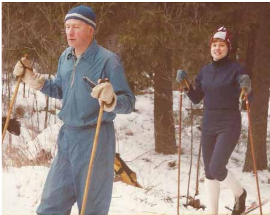
Isäni ja minä hiihtämässä joskus 70-luvun loppupuolella.