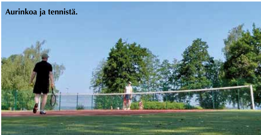
Aurinkoa ja tennistä.